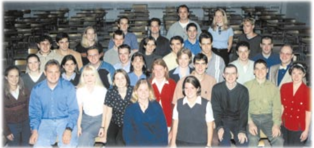
Les stagiaires du programme d'actuariat en 1998.

L a Chaire aura pour but de financer des projets que l'École d'actuariat désire mettre en branle et qu'elle ne peut réaliser dans le cadre de son financement direct par l'Université. La Chaire vise à promouvoir quatre types d'activité et permettra plusieurs réalisations :