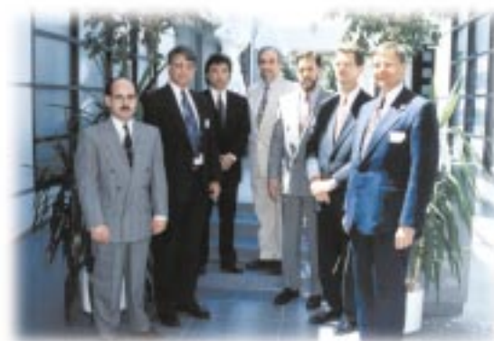
Quelques actuaires participant à une session de formation continue en 1997.

S'assurer de former des diplômés compétents est donc une priorité que nous devons conserver. Développer la recherche et la formation continue en science actuarielle constituera en outre un atout pour le monde des affaires, qui aura à portée de la main les outils les plus récents pour l'évaluation du risque. L'Université Laval est donc fière de contribuer, par la création de la Chaire en actuariat, au développement d'une expertise qui profitera à toute la population.